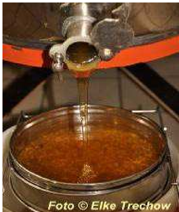
Honig ist ein unverfälschtes Naturprodukt, nach den Schleudern werden lediglich Wachsreste durch Sieben entfernt.

Sind Sie an den köstlichen Honigsorten der Stadtimker interessiert? Auf der Internetseite des Imkervereins Altona finden Sie unter der Rubrik Adressen mehrere Imker aus dem Westen Hamburgs. Weitere Hamburger Imker finden Sie auf den Internetseiten der anderen Hamburger Imkervereine (siehe Rubrik „Links“).