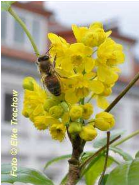
Die Mahonie blüht an Straßenrändern und versorgt die Bienen im zeitigen Frühjahr mit Pollen und Nektar.

In den „Lagenhonigen“ dominieren bei dem einen Imker die Robinien vom Bahndamm, an anderer Stelle die Brombeeren von der Brachfläche. Am nächsten Standort verleihen Esskastanien aus dem Park dem Honig ihr typisches Aroma. Nie aber steht ein Geschmackseindruck allein, immer wird er begleitet von dem Duft der vielen anderen Nektarquellen in der großstädtischen Flora.