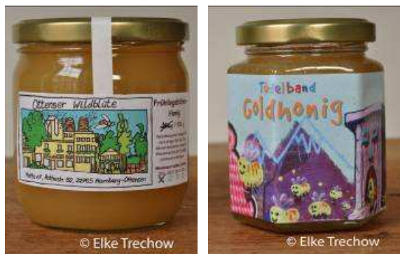
Die untersuchten Honige: aus Hamburg-Ottensen (links) und aus Hamburg-St. Pauli (rechts).

Darüber hinaus gibt es in der Großstadt keine großflächige Ausbringung von Pestiziden auf die Nektarpflanzen der Bienen. Niemand nebelt Linden oder Robinien mit Insektiziden ein. Auch haben die Bienen hier keinen Kontakt zu gentechnisch veränderten Pflanzen. Diese in letzter Zeit immer häufiger auch in Deutschland angebauten Agrarpflanzen werden von vielen Ökologen und Verbraucherschützern äußerst kritisch gesehen. Pollen von gentechnisch veränderten Pflanzen dürfen in Honig nicht vorkommen.