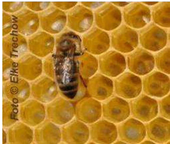
Eine Honigbiene bei der Herstellung von unbelastetem Honig.

Die Luftverschmutzung ist durch Katalysatoren und Bleiverbot bei Kraftfahrzeugen und durch die Rauchgasreinigung bei Kraftwerken heutzutage auch in den Großstädten relativ gering. Ihren Nektar sammeln die Bienen immer aus frisch aufgeblühten Blüten, so dass der Nektar kaum Zeit hatte Luftschadstoffe aufzunehmen. Sollten noch einige Schadstoffe im Nektar vorhanden sein, dann werden diese fettlöslichen Stoffe im Bienenkörper und durch das Wachs der Honigwaben aus dem Honig entfernt. So produzieren die Honigbienen auch unter schwierigen Umweltbedingungen sauberen Honig.