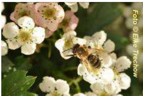
Der Weißdorn ist in der Stadt eine häufig anzutreffende Pflanze, sein Nektar hat meist großen Anteil am Frühjahrshonig.

Da in der Großstadt jeder Stadtteil eine eigene Zusammensetzung an unterschiedlichen Nektarpflanzen besitzt und die Bienen mit ihrem Sammelradius von