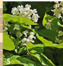
Blühende Bäume sind in Städten wichtige Nektarquellen, hier weniger bekannte Arten.