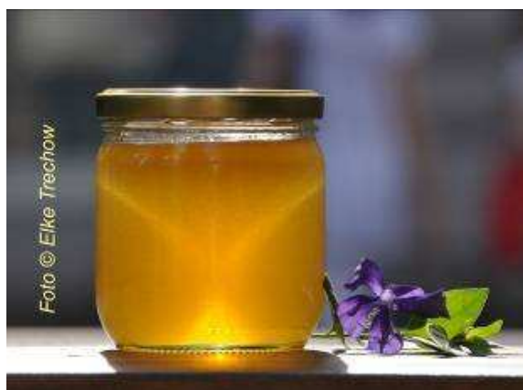
Eine Köstlichkeit: frisch geschleudertes Honig

Folgende Fragen könnten Sie in diesem Zusammenhang interessieren: Ist Stadthonig mit Schadstoffen belastet? Welche